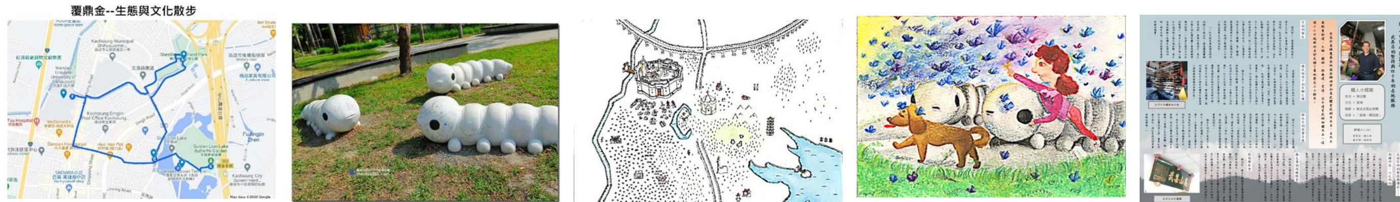
圖3 呈現社區場景的成果文本

本案的精神在場域實踐、跨領域學習與議題關注，故以覆鼎金社區5處具代表性的文史與生態景點為標的，對參與踏查的學生進行施測，發現超過37%的受訪學生未曾到訪過任一處。社區踏查可謂學生開啟社區視野的關鍵學習，對於同步修習夥伴課程的學生具有融入社區意象的助力 (見圖3右側三件作品)。