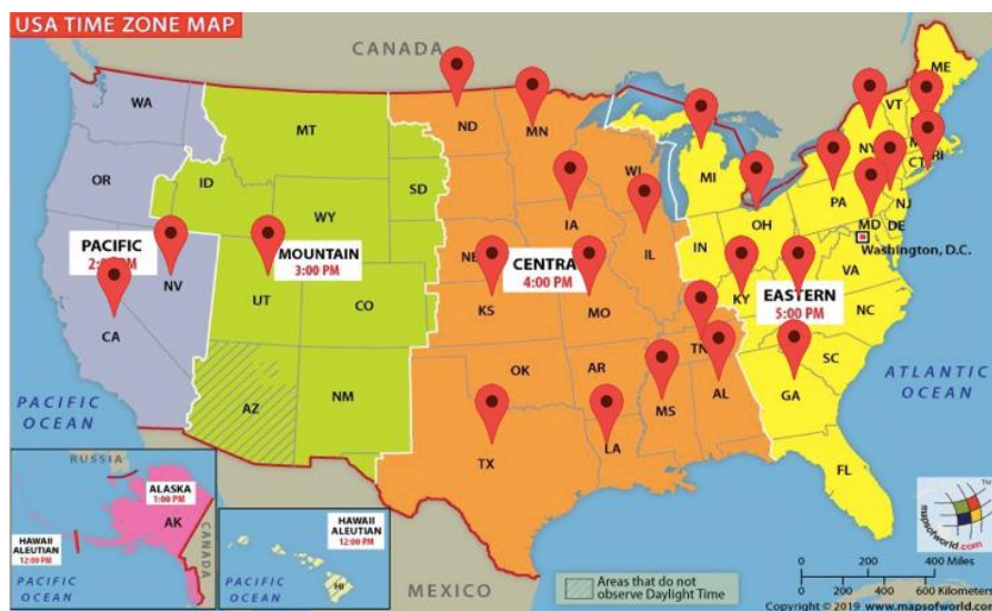
2020 VNSLI-Y 暑期密集課程學員全美五大時區位置圖

別擇選時段授課。台灣時間週二至週五晚上 8:00-8:50，週二至週五晚上 9:00-9:50，週二至週五晚上 10:00-10:50，週二至週五早上 9:00-9:50。