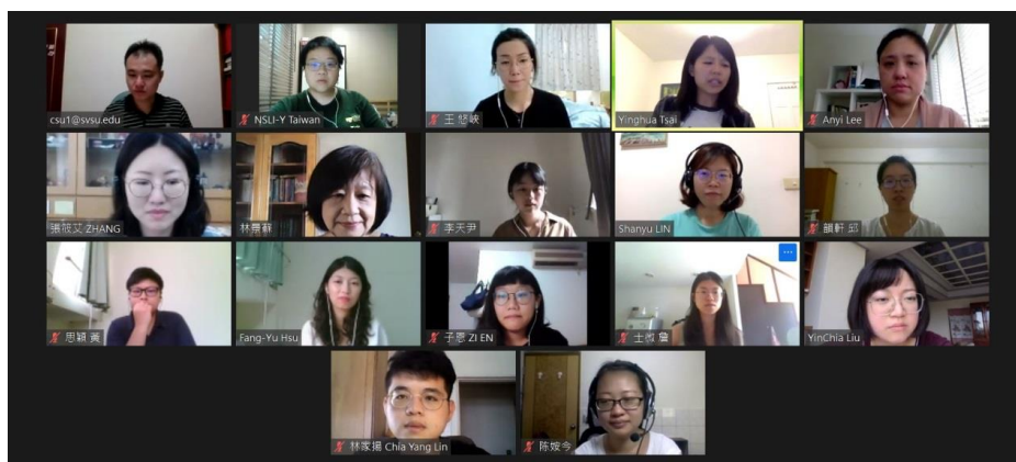
2020 NSLI-Y 暑期密集課程說明與教學管理原則培訓會議(2020/6/21)合影

在助理教師徵選完畢後，6 月 21 日，所有教師舉行了一次線上培訓，參與 2020 VNSLI-Y 暑期密集課程說明與教學管理原則。由四位年級教師分別針對以下內容給助理教師說明研習:如 NSLI-Y 背景了解,本次課程介紹,OPI 內容簡介,教學策略發展(包含語言任務指導技巧,期末報告指導技巧,聽力練習示範教學,及學習目標問卷討論),以及討論助理教師教學任務及教學日誌撰寫等,內容扎實。