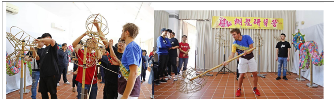
从竹条开始学习完成龙行