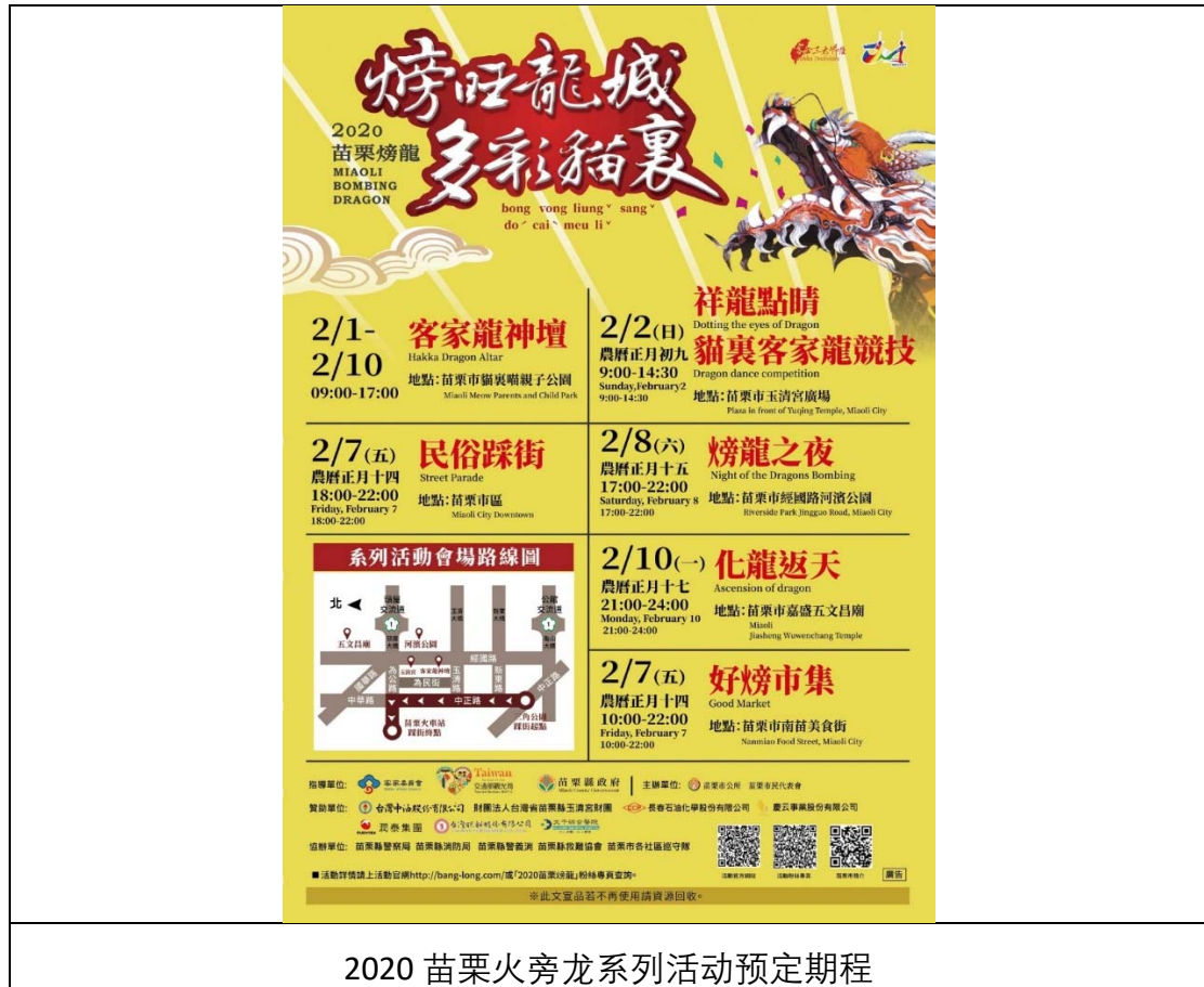
2020 苗栗火焐龙系列活动预定期程

即将近日举办的2020年「苗栗焐龙」已经办21届，21年有成，苗栗市已多年的「焐龙」的无形文化遗产。因此，在2020年苗栗市就以「旺龙城 多彩猫裏」的概念，希望透过活动的举办将该市塑造成全球华人世界的宜居城市－「龙城」，一举拉抬苗栗龙的格局与气势。身为苗栗客家人，诚恳邀请大家莅临指导！