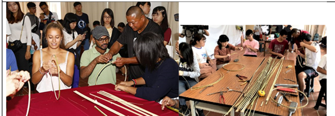
糊龙研习营有国际学生参与体验