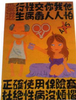
■ Une affiche vue en marge des activités du 1 er décembre à Taichung.

Ensuite, il risque d'être question dans les mois à venir de la nouvelle carte à puce de l'assurance maladie et des données qu'elle renfermera. En effet, les associations communautaires appartenant à l'Alliance pour la protection des informations personnelles attendent un éclaircissement officiel quant au contenu de cette carte et principalement au sujet de l'inclusion ou non de données relatives au sida, comme la prescription d'antirétroviraux, par exemple, qui dévoilerait indirectement la séropositivité du patient. Selon ces associations, la carte à puce aurait plutôt tendance à réduire l'accès aux services et à marginaliser les personnes vivant avec le VIH/sida. Cela étant, les responsables de la santé ont promis d'étudier la question.