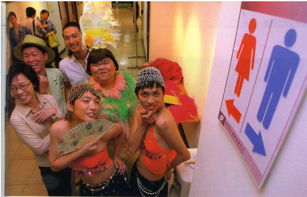
■ Des étudiants homosexuels organisent un jeu de rôle à l'occasion de la Journée mondiale contre le sida.

Demier élément chiffré, 2004 apparaît comme une « année noire » au regard du nombre des infections, puisque c'est tristement la première fois qu'il dépasse largement le cap du millier de nouveaux cas, pour atteindre 1 335 contaminations fin novembre.