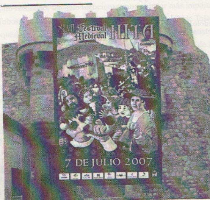
Animación Teatral: TEATRO DESTELLOS

La competencia turística es grande y rutas hay muchas por ello los habitantes de los pueblos no se conforman solo con esperar la visita del turista sino que organizan festejos y aprovechan sus fiestas para aumentar la demanda. Por ejemplo, en Hita se celebran festivales anuales. A continuación podemos ver el cartel promocional del XLVII FESTIVAL MEDIEVAL DE HITTA, Fiesta de Interés Turístico Nacional que se celebró el 7 DE JULIO DE 2007