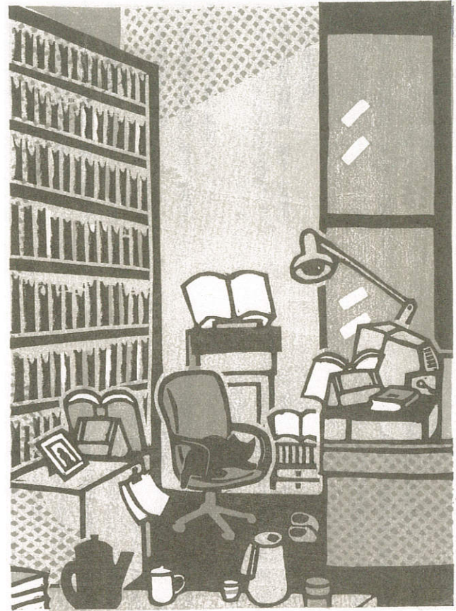
正門時代の藤井研究室（法文1号館413号室） 版画：大野隆司